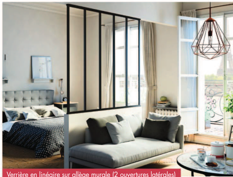
Verrière en linéaire sur allège murale (2 ouvertures latérales)